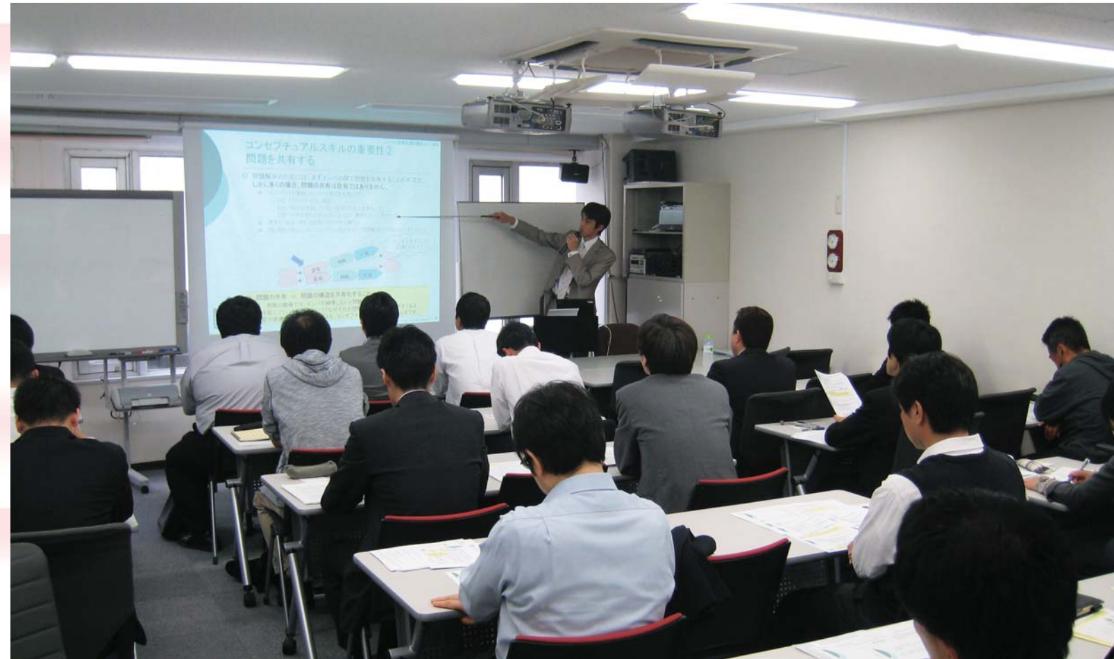
●第1回システム管理者認定講座の様子 (2009年10月23日)